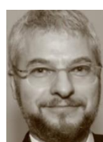
アーシ ローバック