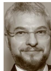
アーミン・ローベック