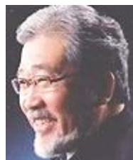
砂田直規 バリトン歌手