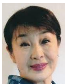
浅利香津代 女優 語り