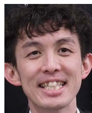
太田みつる 俳優 歌手