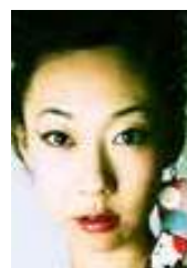
乃々梅 女優 歌手